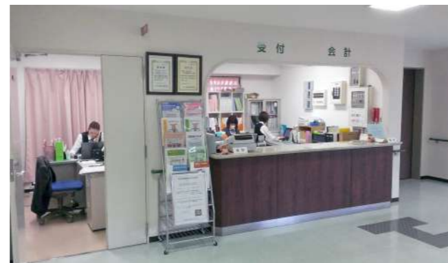
クリニック内風景・受付

運用開始前は難しかった、各医師間の情報や意見の共有化も容易となりました。当クリニックは医療機関とは違い、健診専門施設であるため画像関係は全て 2 人以上の医師による W チェックを行っています。フィルムでの読影の際は、必ず放射線技師が付き添い 1 次読影医から 2 次読影医への申し送り事項を聞き伝えていました。しかし、PACS の導入で、放射線技師が立ち合うことなく所見毎に各医師間の情報・意見を確認することができ、互いの意見や情報をより正確に伝え知ることが出来るようになりました。