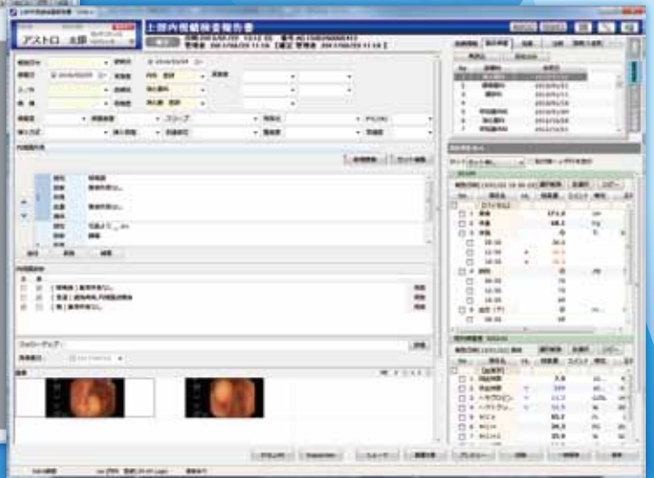
各部門で必要となる特殊なレポートフォームにも対応

Sophia Report (ソフィアレポート) はユーザによるフォーム作成機能から、チーム医療のワークフロー、各部門の複雑なレポート機能まで幅広くサポートするドキュメント作成&管理システムです。文書作成はエクセル等から自動でフォームを読み込み、各コントロールも簡単操作で配置ができます。文書という括りで今までバラバラだったシステムを統一化することができます。