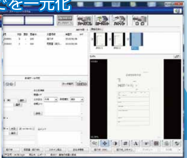
紹介状をスキャン

Regulus (レグルス) は連携室の各種業務をこの製品 1 つで行えるように設計されたシステムです。紹介状のスキャンから、相手先への状況報告、それらの文書を FAX 機で自動送信することが可能です。またドクターの返書の作成管理までをトータルにサポートしています。