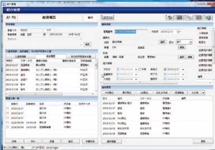
患者単位の管理が可能