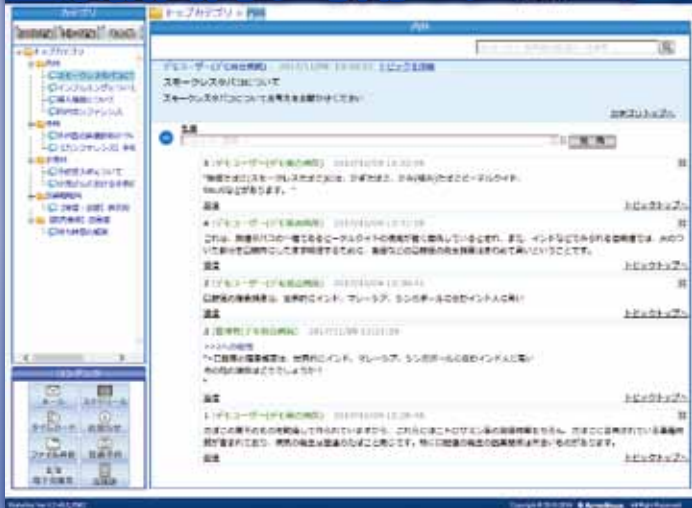
グループウェアの電子会議室画面