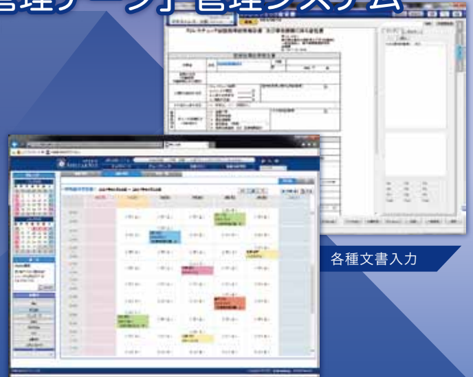
診療 WEB 予約