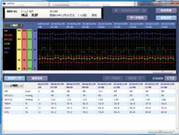
生体モニタの集中表示