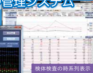
検体検査の時系列表示