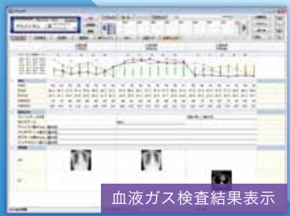
血液ガス検査結果表示