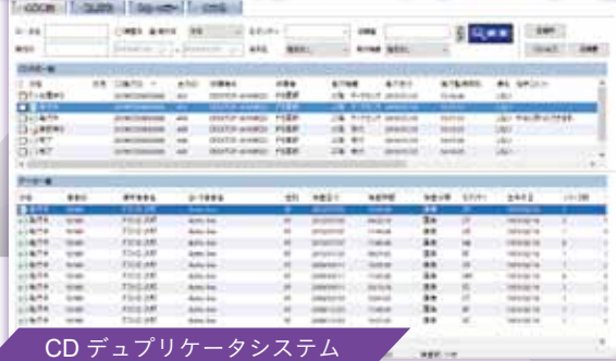
CD デュプリケータシステム

Ace Writer (エースライター) は CD や DVD、BD へのデータの出力からラベル印刷の手配までできる CD デュプリケータシステムです。出力依頼 XML の情報をもとに CD 作成が行え、作成ジョブ確認画面で状況の確認やジョブの操作が可能です。また、複数デュプリケータ自動割り振り機能を使えば、ユーザー側で仕事量を比較してデュプリケータ機器を指定することなく、均等に CD 出力を行うことができ便利です。