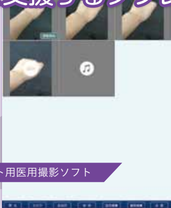
タブレット用医用撮影ソフト

Ace Photo (エースフォト) は医療現場において診察の手助けとなるカメラ機能を備えた、タブレット画像撮影ソフトです。患者情報と共に検査種別を、撮影した画像や動画に付与して、診療情報統合システム STELLAR (ステラ) の時系列に検査として送信が可能です。